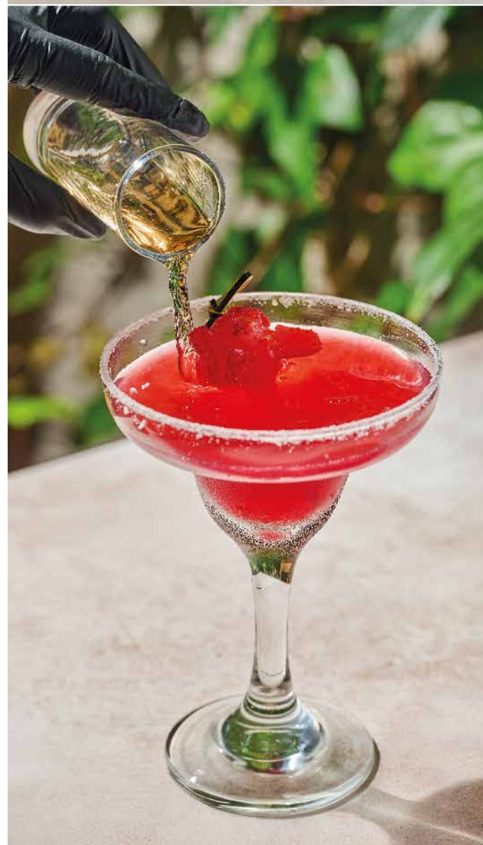
FRUTOS DEL SOL