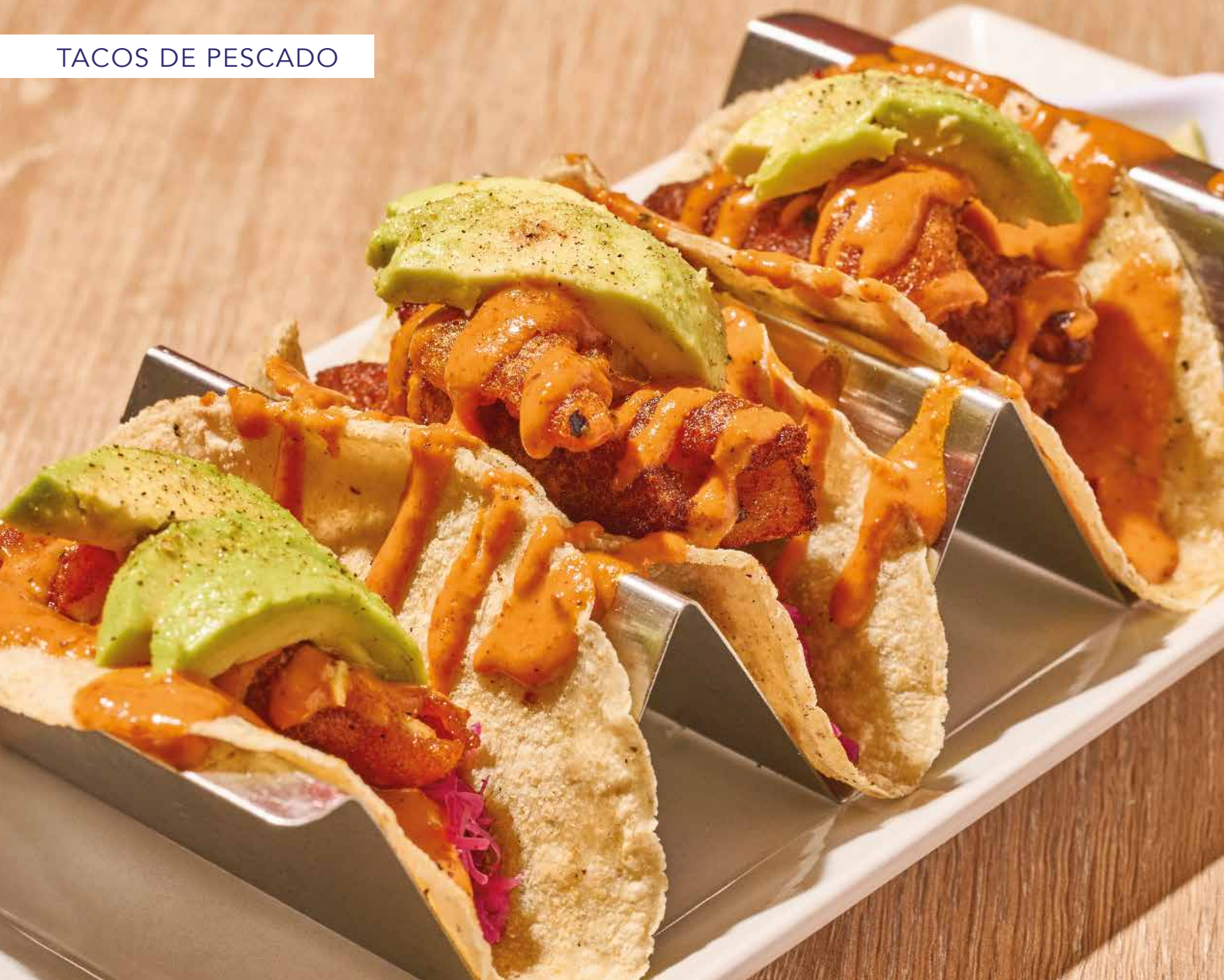
TACOS DE PESCADO