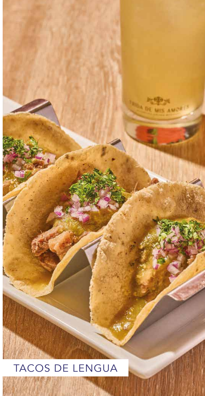
TACOS DE LENGUA