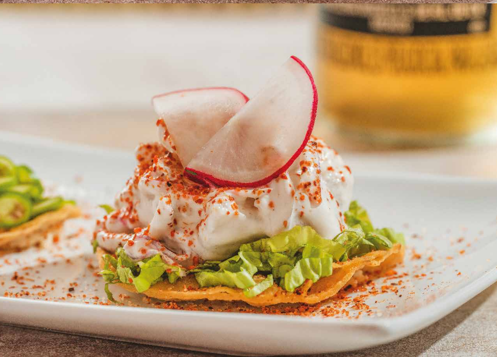
TOSTADAS DE CEVICHE