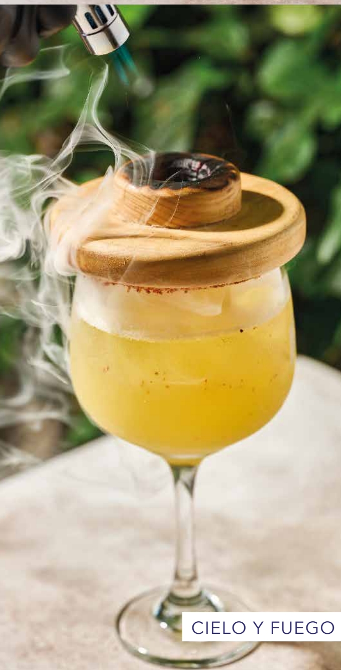
CIELO Y FUEGO